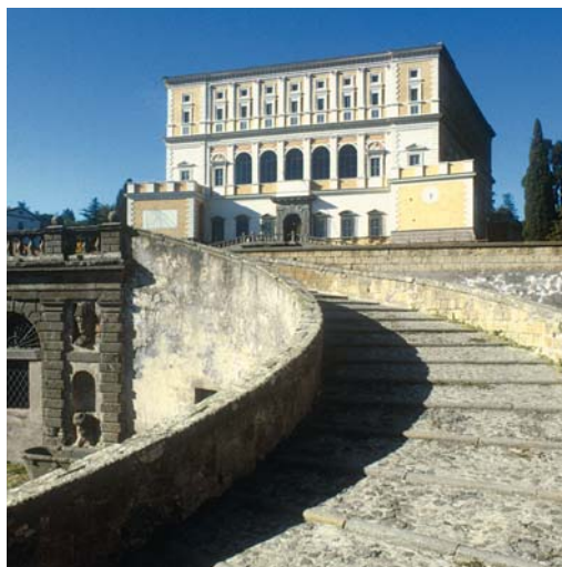
Palazzo Farnese. La facciata e, a sinistra in basso, il giardino all'italiana

Il Piano Rialzato, detto dei Prelati, con ambienti affrescati da Taddeo e Federico Zuccari, permette di raggiungere lo straordinario cortile progettato dal Vignola in forma circolare, composto da due porticati sovrapposti le cui volte vennero magistralmente affrescate da Antonio Tempesta, come pure le pareti della scala elicoidale interna la cui originale interpretazione usciva dalle regole dell'epoca tanto che venne chiamata Scala Regia. Sopra è il Piano Nobile, diviso in due appartamenti: quello estivo affrescato da Taddeo e Federico Zuccari, e quello invernale dipinto dal Bertoja, da Raffaellino da Reggio e da Giovanni De Vecchi. Qui si trova anche la Stanza dei Fasti Farnesiani, che narra negli affreschi la storia della famiglia.