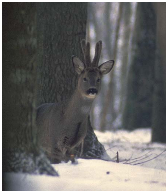
Maschio adulto di capriolo con palco in velluto.

Nella porzione nord-occidentale la presenza del capriolo è estesa soprattutto nei comuni di Latera, Valentano, Farnese, Ischia di Castro e Canino (Tabella 3.1). La presenza nei comuni di Cellere e Tuscania può essere considerata ancora occasionale, in quanto le informazioni derivano esclusivamente dall'indagine condotta sulle Aziende Faunistico Venatorie; rimangono dubbie, per l'attribuzione a livello di specie, le segnalazioni relative ad osservazione diretta di animali da parte di personale di vigilanza e cacciatori esperti, nel comune di Tuscania.