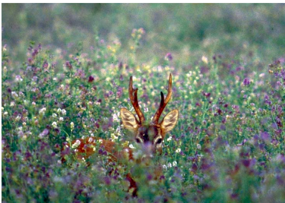
Maschio adulto di capriolo

La notevole estensione del capriolo a nord della Provincia è riconducibile alla continuità ambientale con i territori toscani delle province di Siena e Grosseto, in cui la specie risulta presente da anni con consistenze tra le più alte d'Italia (Pedrotti et al. , 2001); insieme a questo la tipologia di ambiente, caratterizzato da un elevato coefficiente di boscosità rappresentato da boschi di latifoglie e boschi misti, ha senza dubbio facilitato la diffusione degli animali.