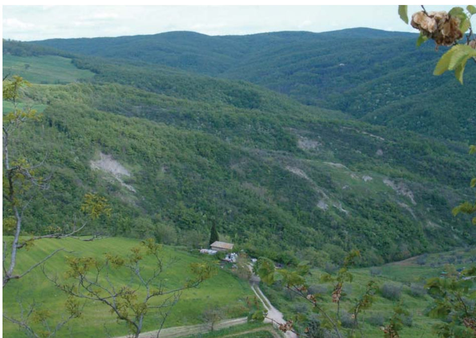
Particolare dell'area sperimentale 1.

Dal punto di vista vegetazionale è caratterizzata da una preponderanza di aree aperte che rappresentano 63,5% del territorio e sono costituite da un 55-60% di seminativi e 10-11% di colture agrarie con spazi naturali. Le superfici boscate comprendono boschi di latifoglie ed aree a vegetazione boschiva ed arbustiva.