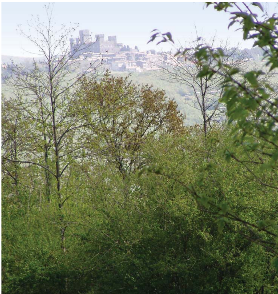
Particolare dell'area sperimentale 2.

Situata immediatamente più a sud dell'area di indagine sperimentale 1 (comune di Acquapendente), la seconda area sperimentale è divisa in due parti dall'Azienda Faunistica Venatoria "la Gallicella". Ha un'estensione complessiva di 5.508,1 ettari, con pendenze medie del 10% ed esposizione prevalente a nord-ovest. Dal punto di vista altimetrico è compresa rispettivamente tra un minimo ed un massimo di 210 e 600 metri s.l.m. e la maggior parte del territorio ricade tra le quote comprese tra 400 e 500 metri s.l.m. (68,7%). Dal punto di vista vegetazionale è caratterizzata da una prevalenza di aree aperte che rappresentano il 70,0% del territorio e sono costituite da un 99,5% di coltivazioni (colture agrarie con spazi naturali, seminativi e sistemi colturali e particellari) e da un 0,5% di pascoli naturali. Nelle aree boscate predominano vegetazione boschiva ed arbustiva, boschi di latifoglie e boschi misti di conifere e latifoglie.