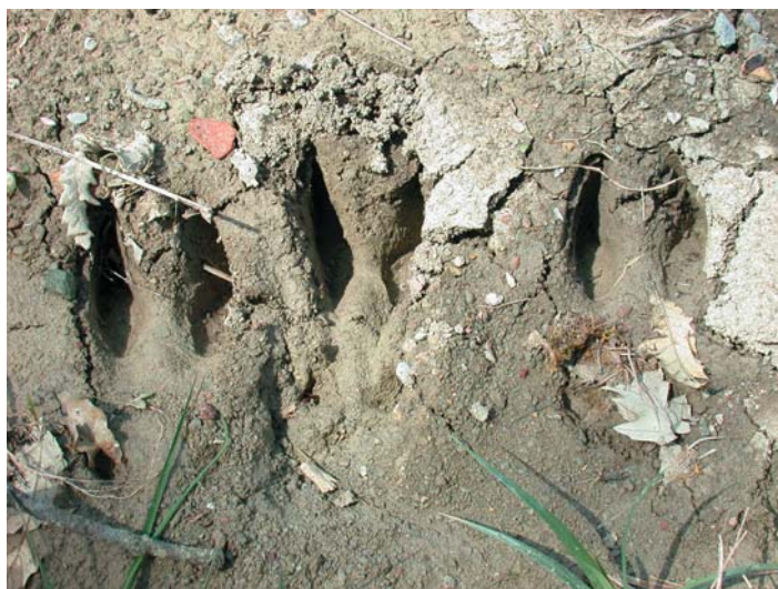
IMPRONTE DI CINGHIALE NEL FANGO